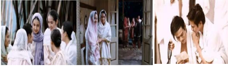
Gambar 3 : Adegan dalam filem yang menggambarkan tentang amalan yang baik seperti ikatan persaudaraan.

Beberapa shot dalam film ini menampilkan makna moral positif yang ditunjukkan dalam bentuk kerja sama antar sesama dan terjalinnya rasa percaya yang biasa disebut dengan “ persahabatan ”. Persahabatan menggambarkan suatu hubungan yang melibatkan pengetahuan dan penghargaan. Sahabat sejati nilainya tiada bandingan. Dia ibarat berlian yang terbenam di dasar lumpur. Meskipun berbalut kekotoran, gemerlap sinarnya terserlah. Sahabat sejati juga menjunjung erti setiakawan, kejujuran dan bertanggungjawab. Sama bergembira di waktu senang, membimbing dan membantu sewaktu diri tergelincir dari batasan. Menurut Imam Ghazali, persahabatan itu harus dilandaskan dengan jiwa yang bersih. Malah, Rasulullah S.A.W pernah bersabda: “Tidak sempurna iman kamu jika kamu tidak mengasihi kawan lebih drp kamu mengasihi diri sendiri”. Begitulah besarnya pengertian persahabatan dalam Islam bersandarkan konsep persaudaraan.