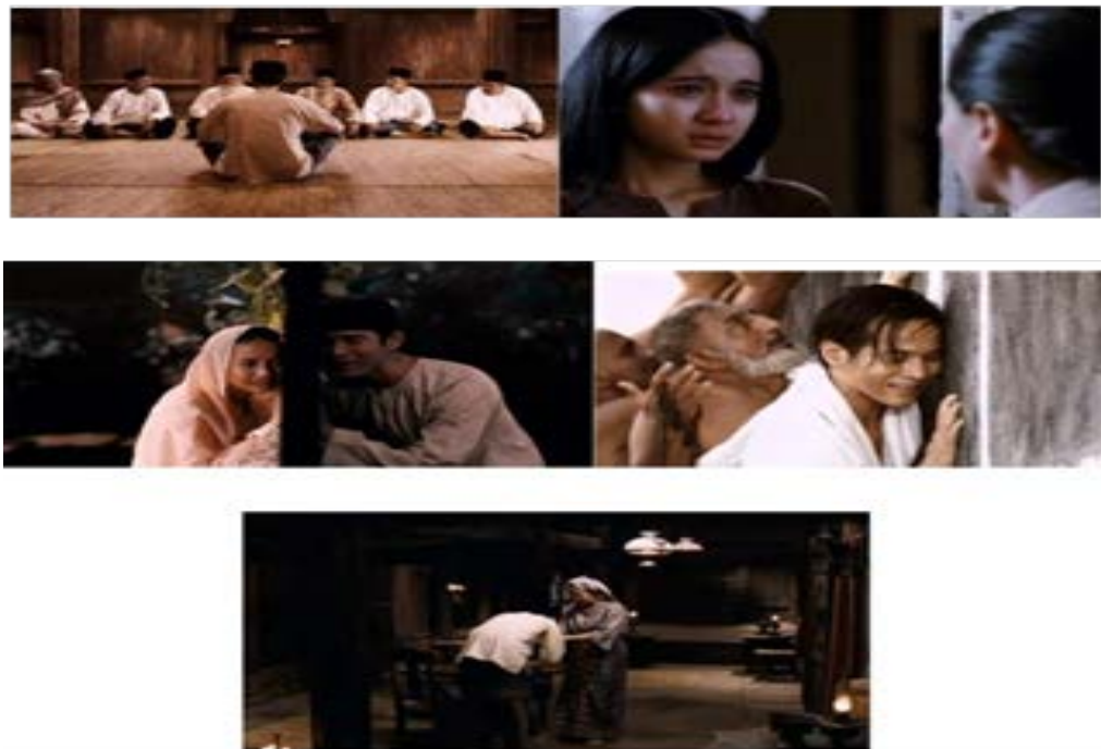
Gambar 1 : Adegan dalam filem yang menggambarkan tentang pembersihan jiwa sebagai kunci pertama dan utama bagi membentuk akhlak yang terpuji.

Beberapa shot filem ini menunjukkan makna moral yang positif, hal ini ditunjukkan dalam sikap dan perilaku seseorang yang selalu taat pada setiap aturan dan kaedah yang berlaku baik dalam agama, masyarakat dan keluarga. Ertinya bahawa kelangsungan hidup manusia berlangsung dalam suasana saling bantu membantu dan bekerjasama dalam pelbagai aspek kehidupan.. Untuk itu manusia dituntut agar saling bekerjasama, saling menghormati, tidak mengganggu hak orang lain, toleransi dalam hidup bermasyarakat. Sifat toleransi atau bertolak ansur mampu bekerjasama, saling menghormati, tidak mengganggu hak orang lain adalah menyangkut penghargaan diri, tanda keterbukaan hati dan kebesaran jiwa.